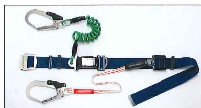
●カール100 (ロープタイプ補助ロープ付)