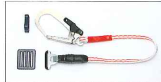
ロープタイプ補助ロープ