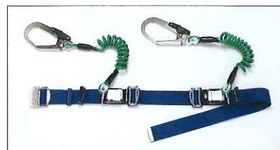
●カール100 (カールタイプ補助ロープ付)