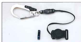
リールタイプ補助ロープ

ショックアブソーバは、従来品 より小型軽量化を実現。 作業時の負担を少なくしました。