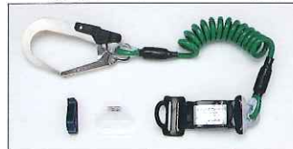
カールタイプ補助ロープ

ロープの架け替え時の危険を少なくする補助ロープ付も新たに ラインアップしました。補助ロープにはリールタイプとロー プタイプの2種類を用意。それぞれショックアブソーバ付 100kg対応ですので、ご購入時にお選びください。