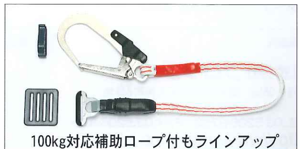
100kg対応補助ロープ付もラインアップ

ロープが伸縮自在のカールタイプになり、現場でのロープの取り回しが楽になりました。さらに作業総重量100kgまで対応して新登場。ショックアブソーバ搭載の補助ロープ付もラインアップしご希望に合わせた安全帯をお選びいただけます。