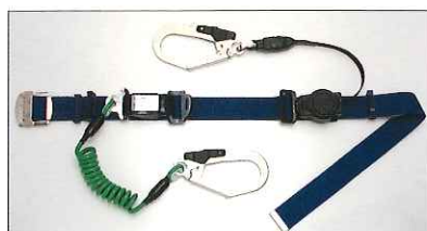
●カール100 (リールタイプ補助ロープ付)